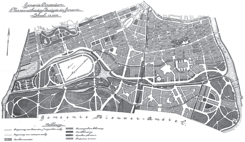
Berlages Plan Zuid van 1905

lijk een station in Plan Zuid. Ook overwoog de gemeente in dit grote gebied een aantal openbare gebouwen neer te zetten, zoals een Academisch Ziekenhuis, een gebouw voor de Vrije Universiteit, een clubhuis voor roeivereniging De Hoop, een gebouw voor de Rijkverzekeringsbank en een Academie voor Beeldende Kunsten. Berlage kreeg de opdracht het ontwerp van 1905 aan te passen aan deze nieuwe eisen.