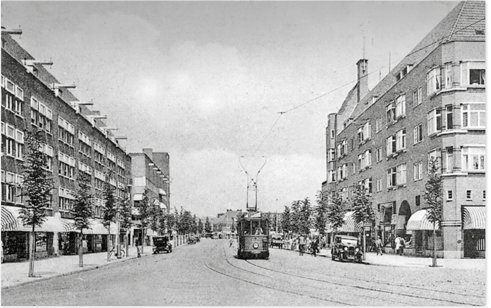
Tram 24 rijdt richting centrum eind 1930. Het blok Beethovenstraat nr. 3-9 tussen Apollolaan en Corellistraat is nog niet gebouwd.