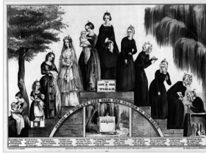
Vrouwelijke levenstrap (vroeg 19de eeuw)

huiskamers en boerenhoeves, en ook als waarschuwing tegen het najagen van aards bezit en ijdelheid.