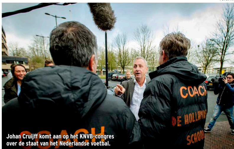
Johan Crujff komt aan op het KNVB-congres over de staat van het Nederlandse voetbal.